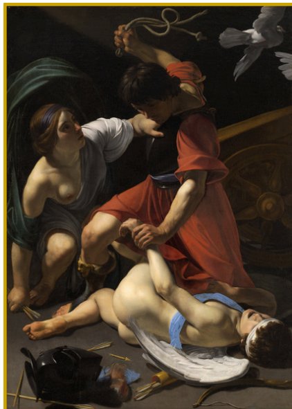
Bartolomeo Manfredi, Cupido castigato , 1613